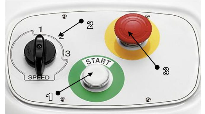
3 HIZ ÖZELLİĞİNE SAHİP KONTROL PANELİ SEMBOLLERİ