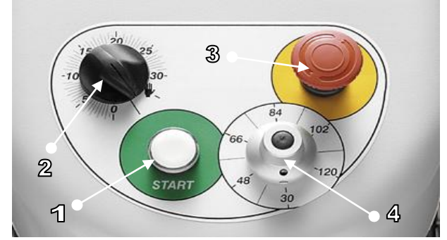
HIZ VE ZAMAN KONTROL ÖZELLİKLERİNE SAHİP KONTROL PANELİ SEMBOLLERİ